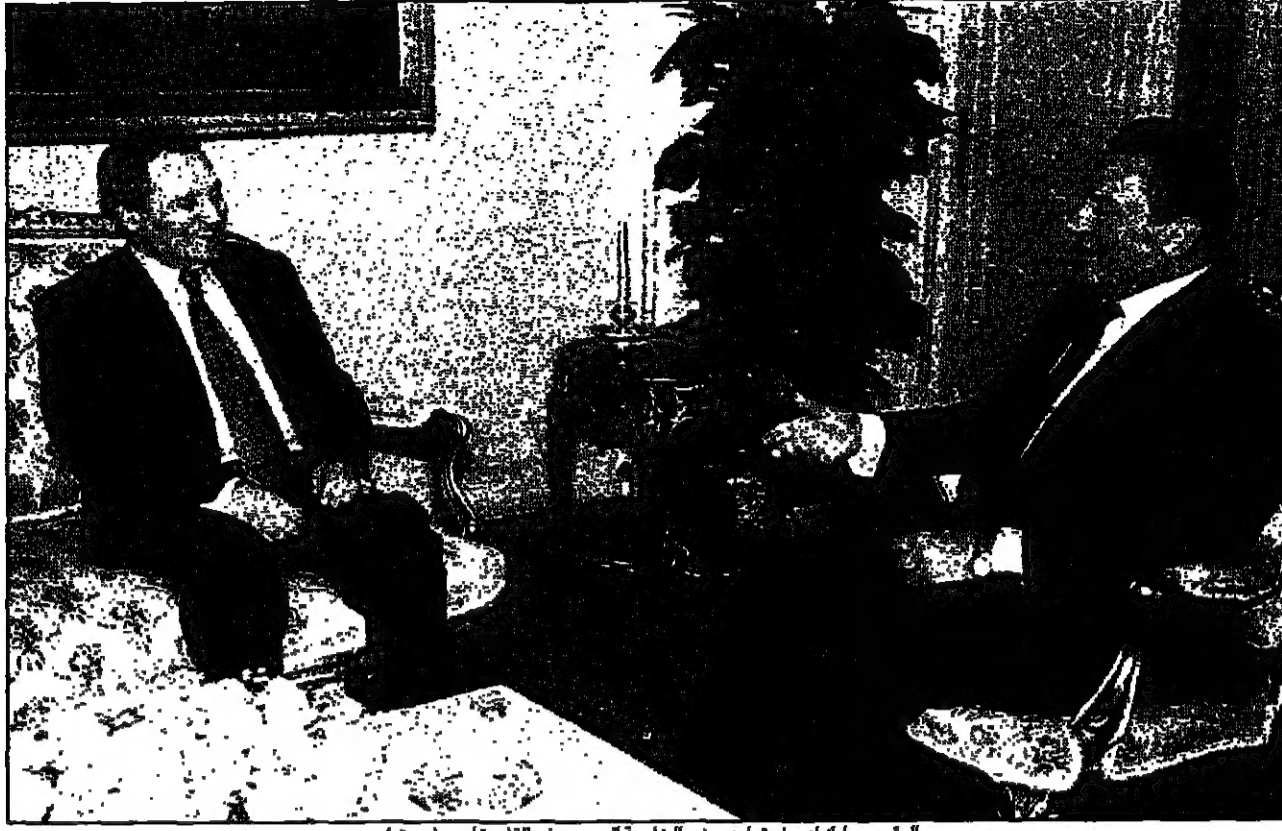
الرئيس مبارك لدى اجتماعه مع سفير الخارجية الاسرائيلي في القاهرة